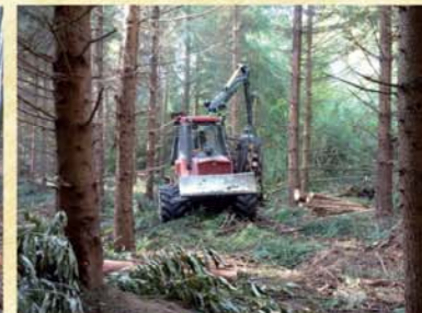
Première éclaircie résineuse