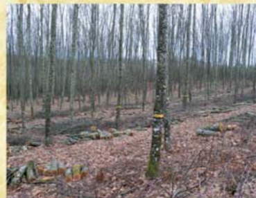
Première éclaircie feuillue