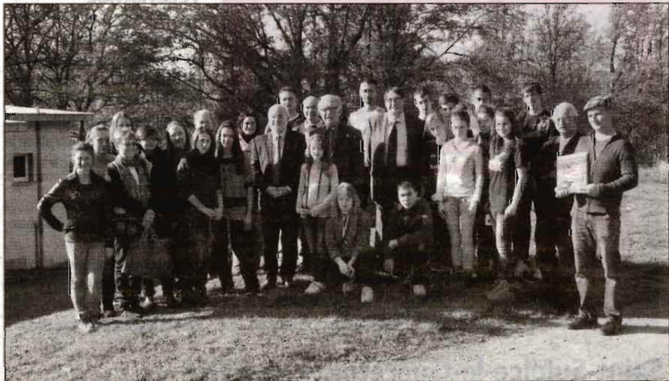
Une délégation de Roumains, dont 2/3 d'ados, à la découverte de la forêt creusoise et sites guérétois.

Depuis mardi, une délégation de Roumains hongrophones est en Creuse. 16 adolescents et 7 adultes vont découvrir le Pays de Guéret dans le cadre du projet européen Sharewood. Ce programme vise à échanger les bonnes pratiques entre partenaires autour de la forêt. En la matière, ces Roumains n'ont pas à rougir !