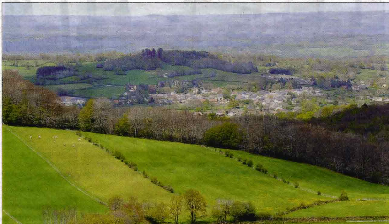
PANORAMA. Le chantier d'élagage des Trois Cornes avance bon train. La vue est dégagée et le site sera opérationnel en juin.