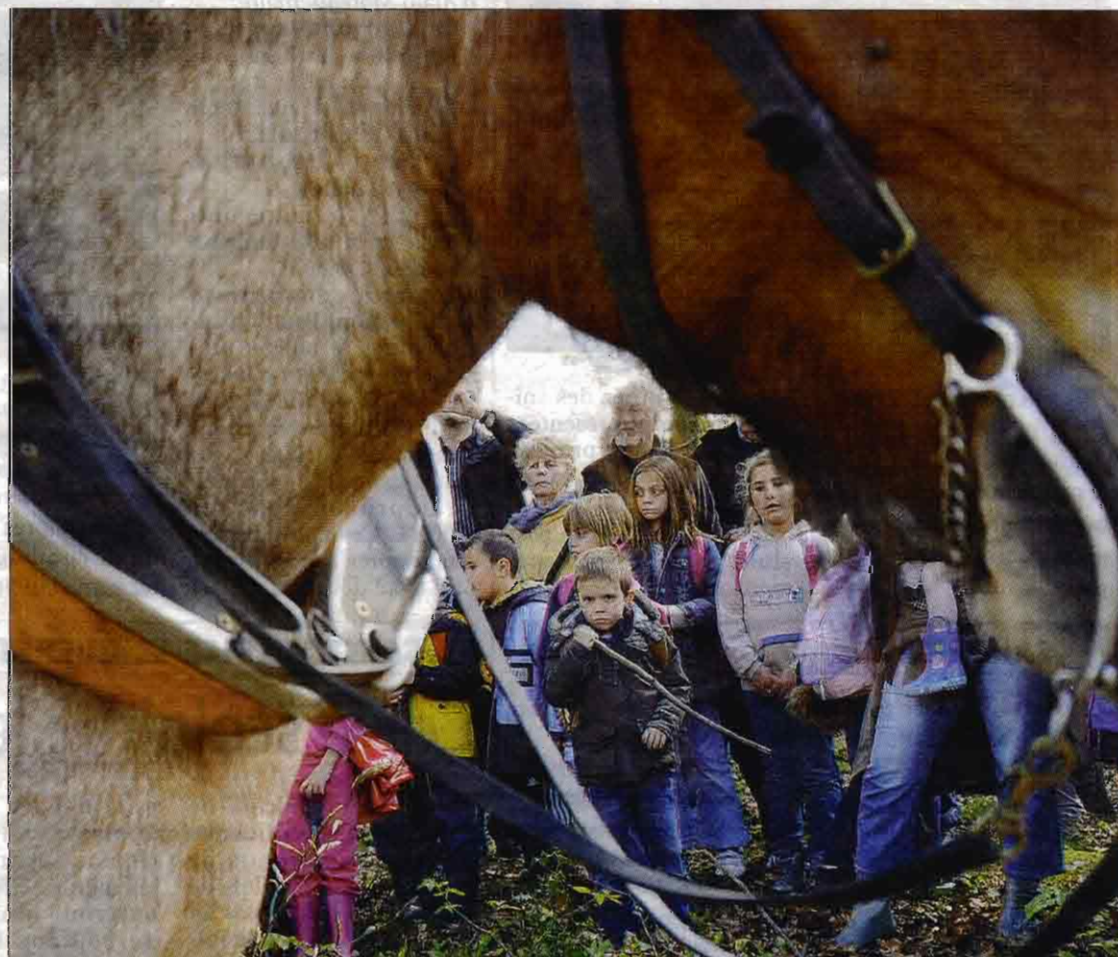
DOUBLE EMPLOI. Sur le site, accidenté et classé, le cheval est le recours idéal. Mais hier, le cheval n'était pas seulement un outil destiné à la traction, il était l'attraction à part entière.