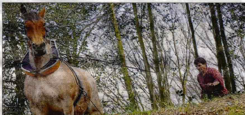
ÉCOLOGIE. Les appareils mécaniques sont plus économiques au départ, mais c'est sans compter la remise en état des lieux après leur passage.