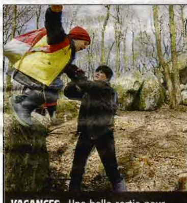
VACANCES. Une belle sortie pour les enfants du centre aéré.