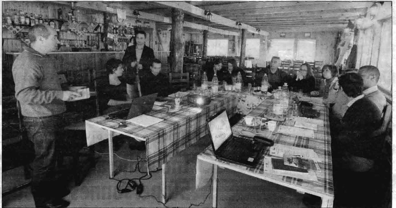
En Roumanie, la Charte forestière du Pays de Guéret prend une dimension européenne.

L'axe principal de ce travail est de rendre à la forêt sa multi-fonctionnalité. Il s'agit au mieux faire cohabiter